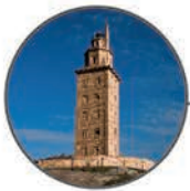
Torre de Hércules