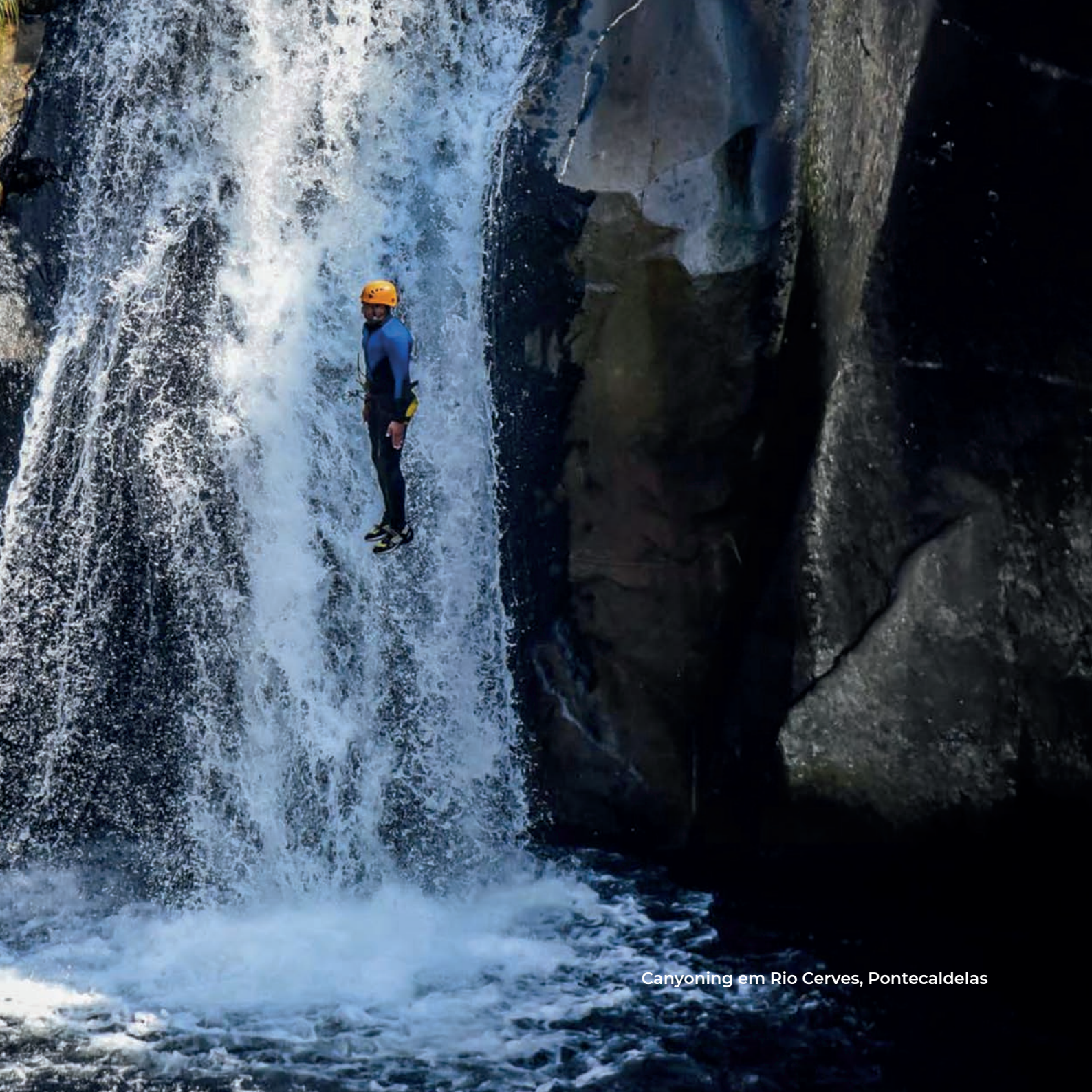
Canyoning em Rio Cerves, Pontecaldelas