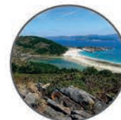
Parque Nacional Marítimo-Terrestre de las Islas Atlánticas