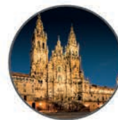
Catedral de Santiago de Compostela