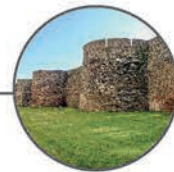
Muralla Romana de Lugo