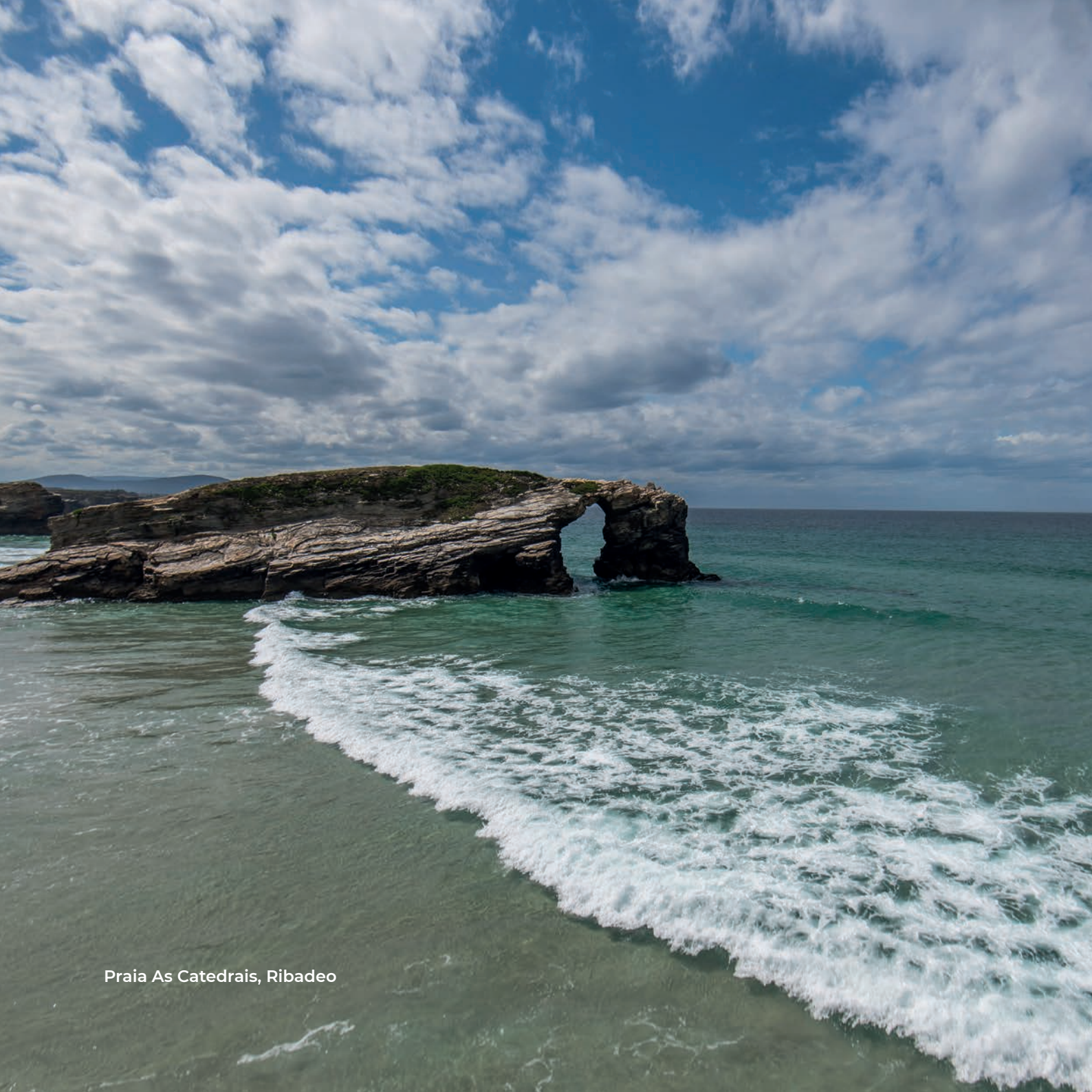
Praia As Catedrais, Ribadeo