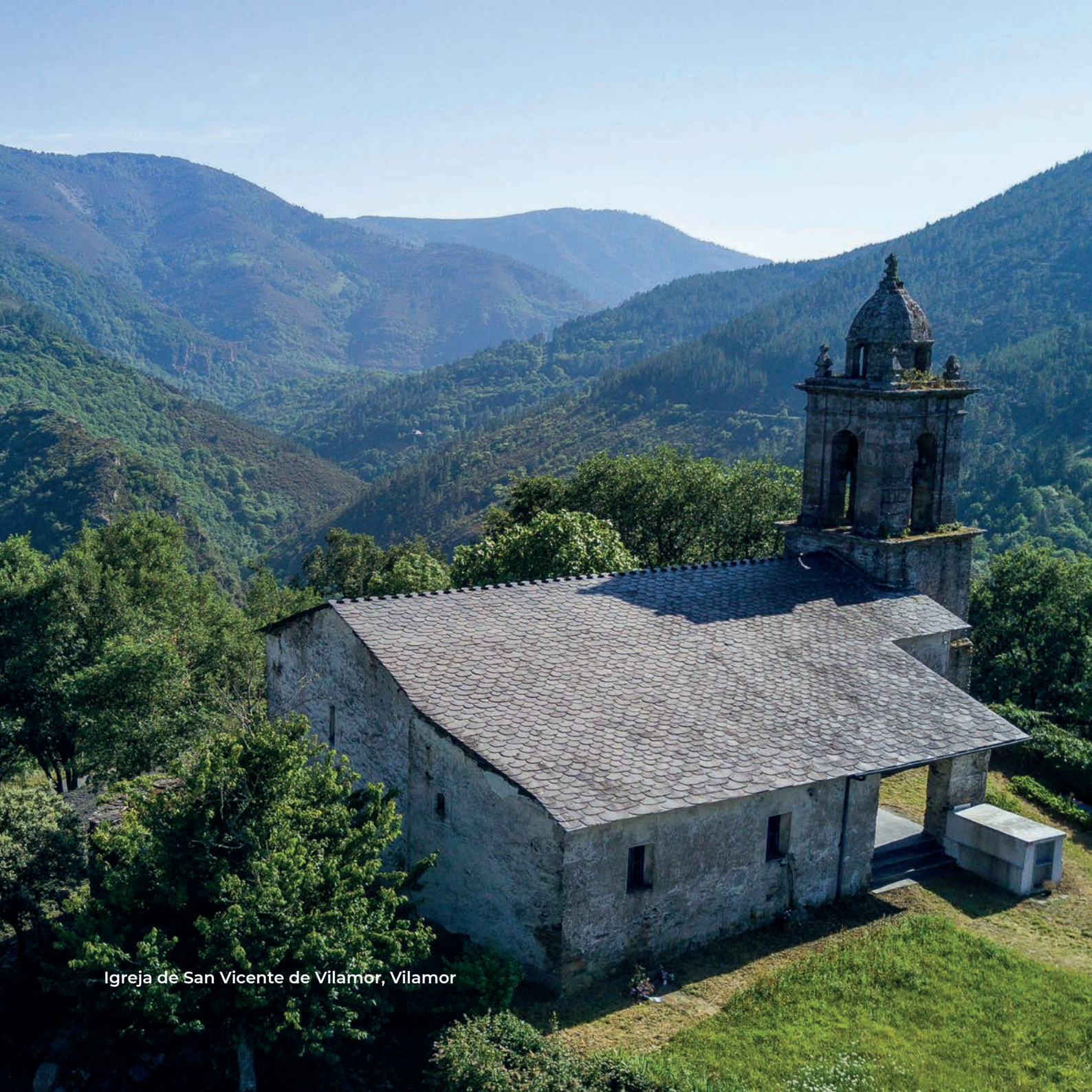
Igreja de San Vicente de Vilamor, Vilamor