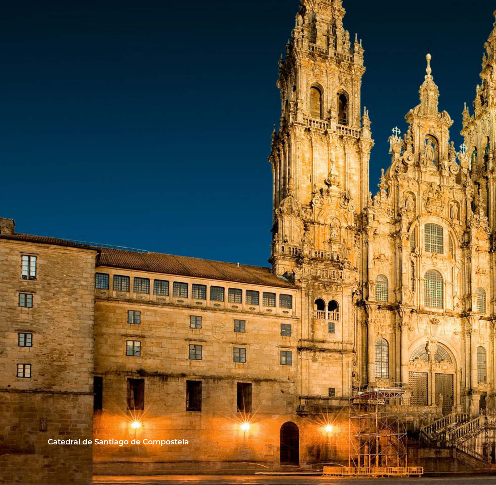
Catedral de Santiago de Compostela