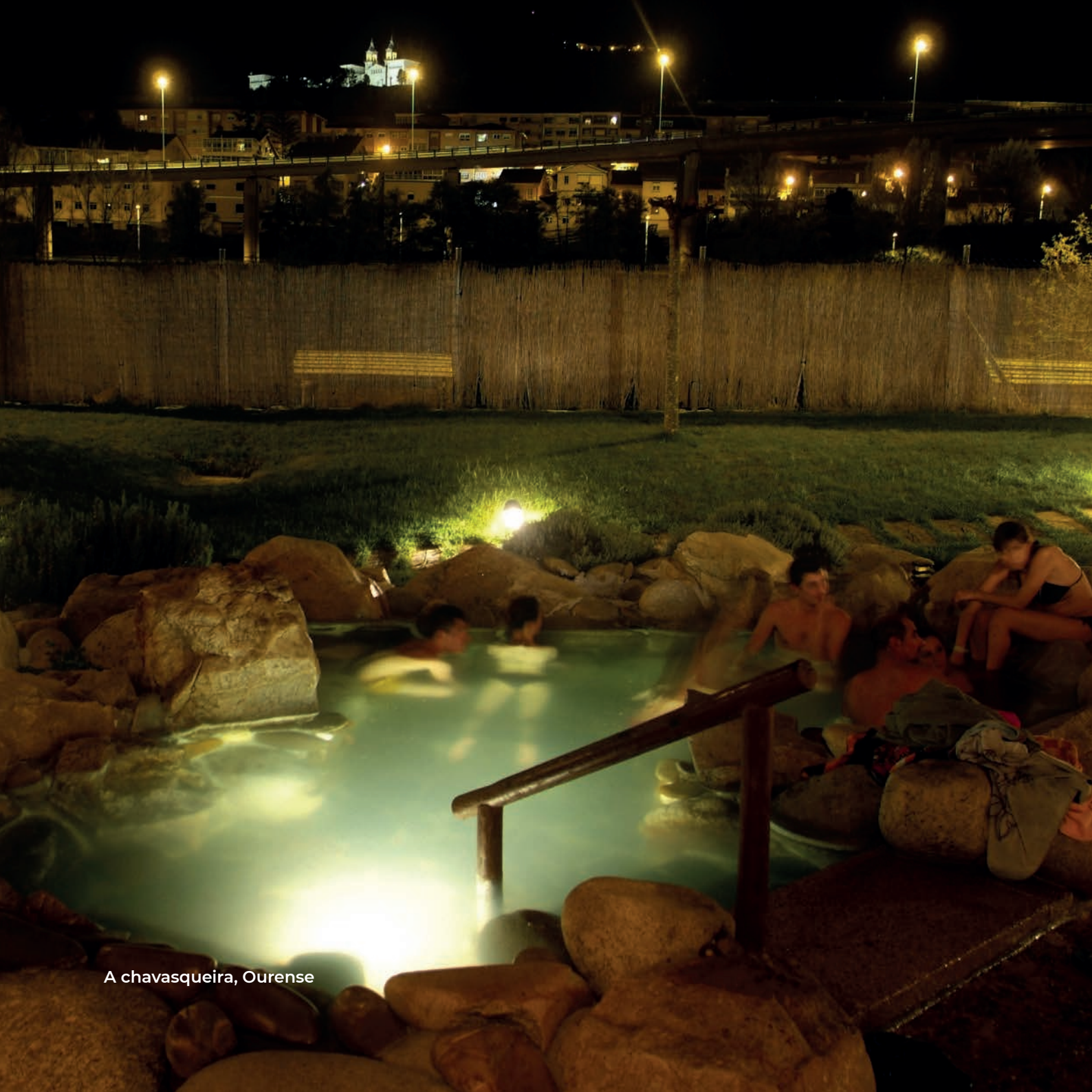
A chavasqueira, Ourense