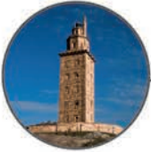
Tower of Hércules