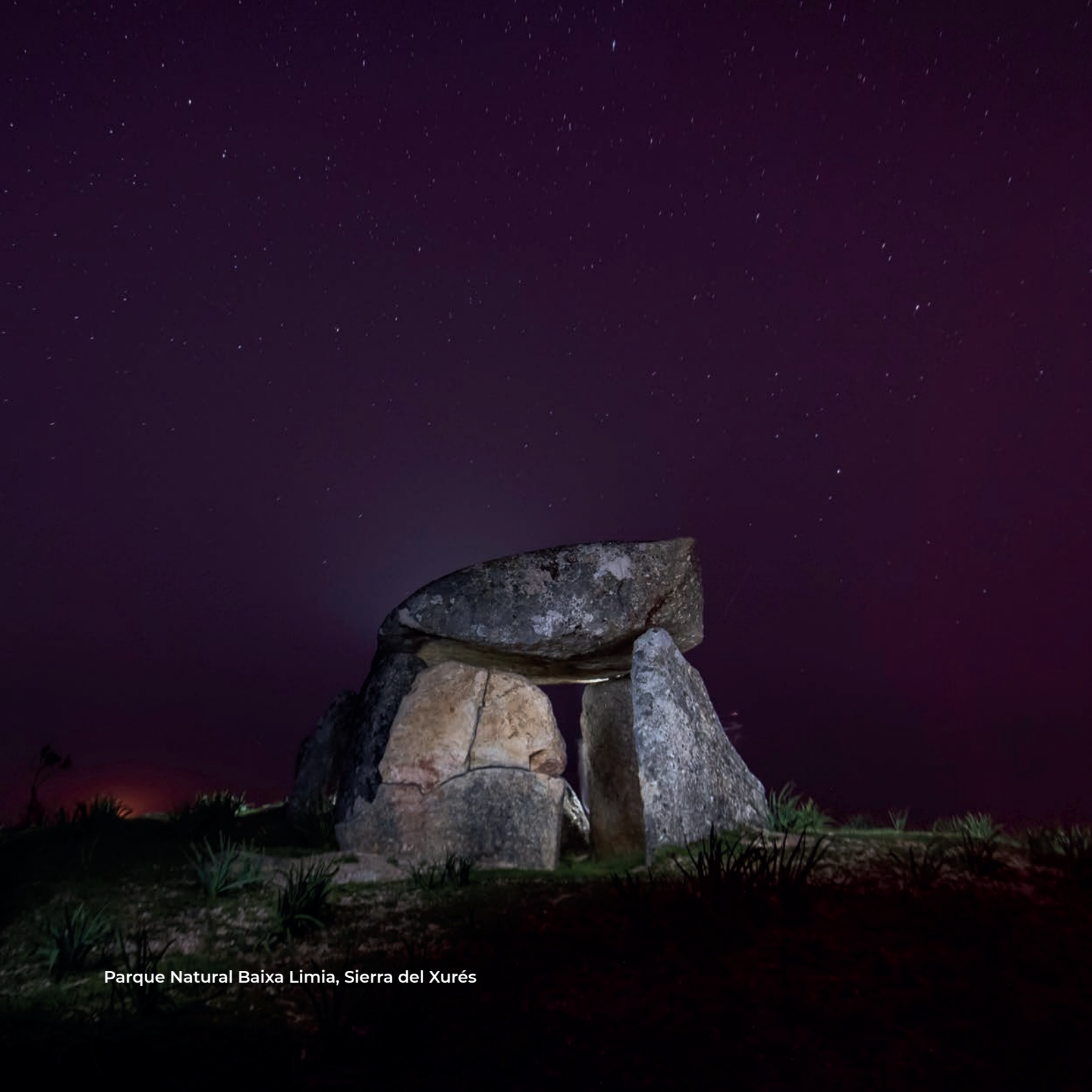
Parque Natural Baixa Limia, Sierra del Xurés