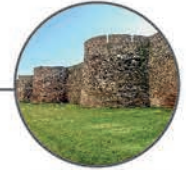
Roman wall of Lugo