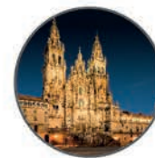
Cathedral of Santiago de Compostela