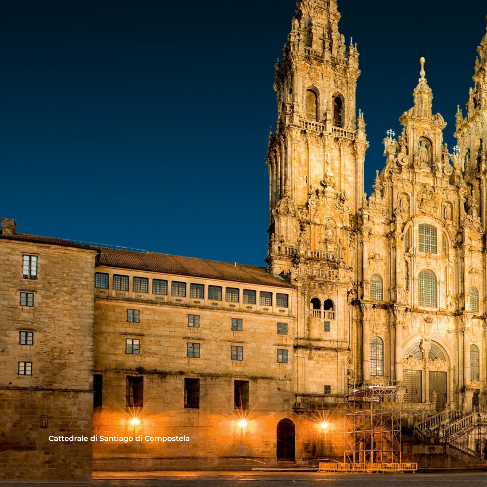
Cattedrale di Santiago di Compostela