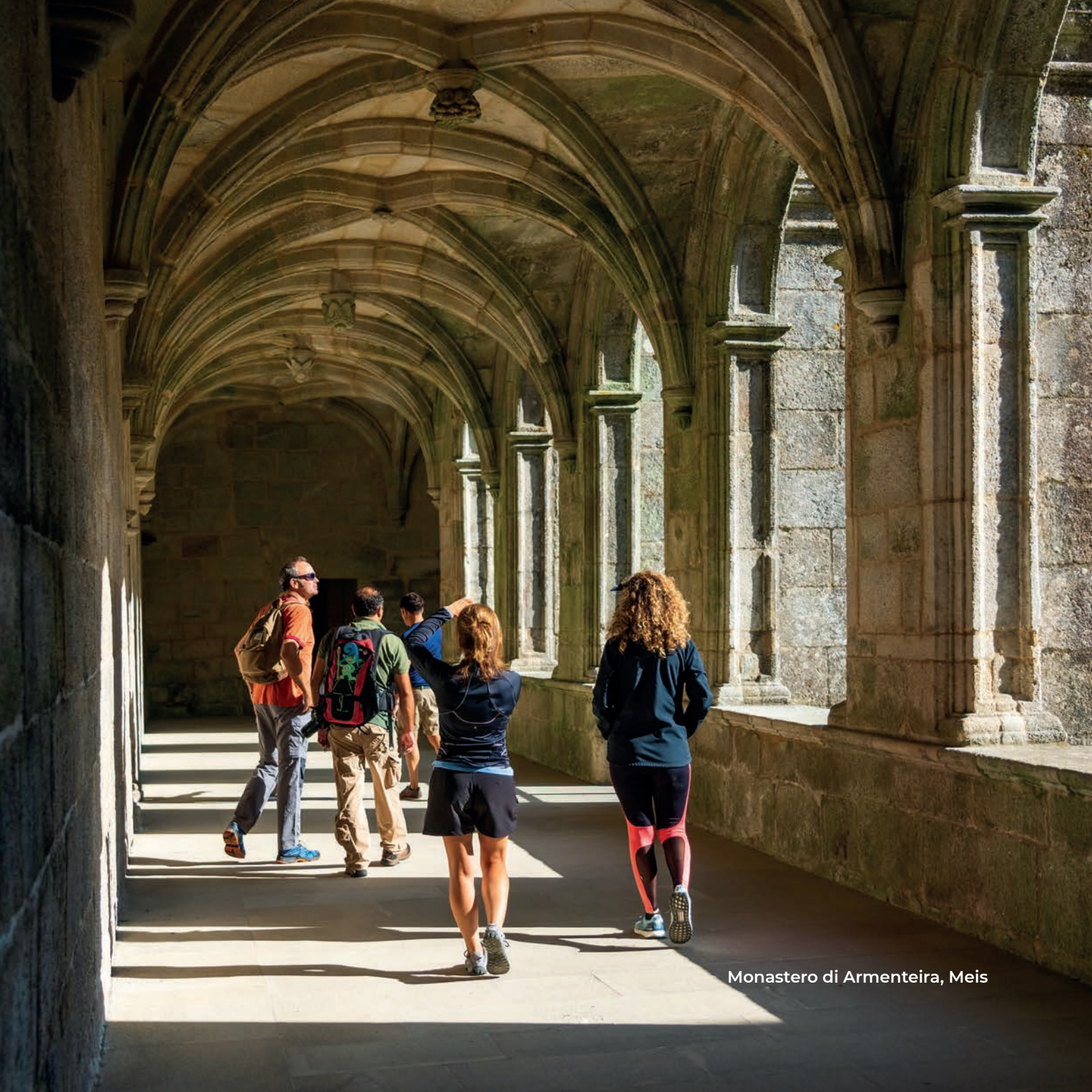
Monastero di Armenteira, Meis