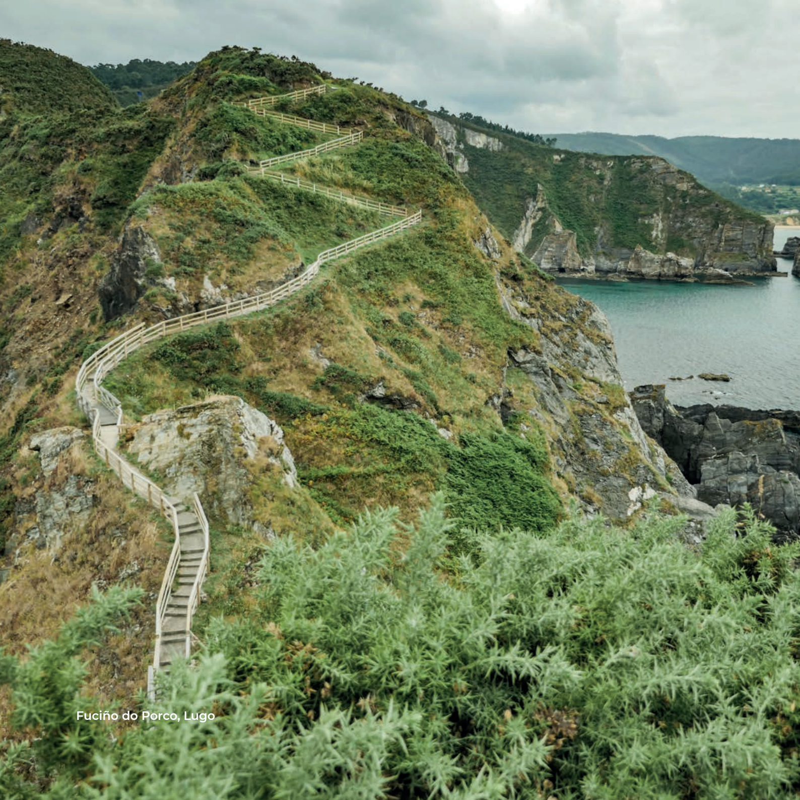
Fuciño do Porco, Lugo