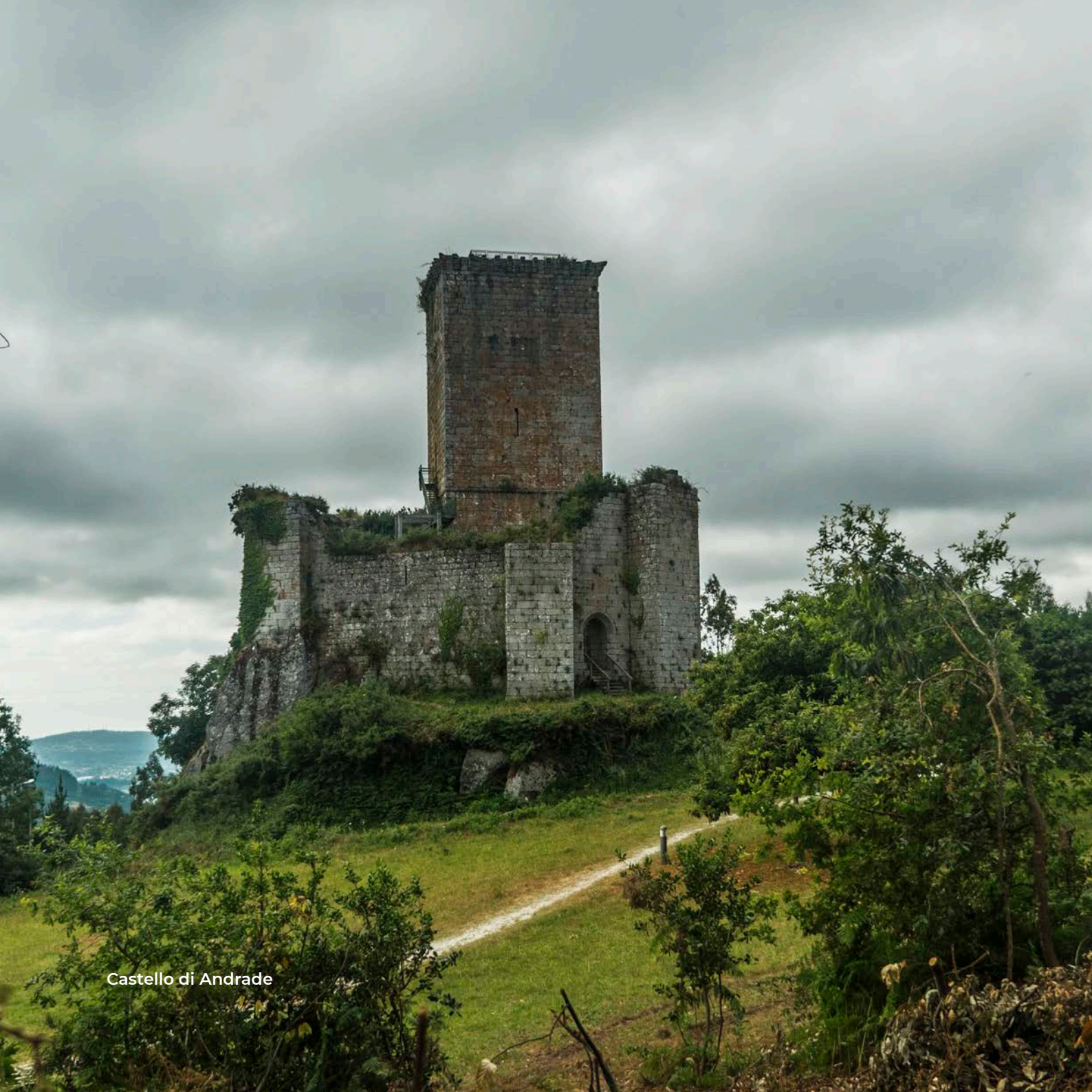
Castello di Andrade