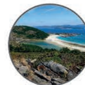
Atlantic Islands National Park