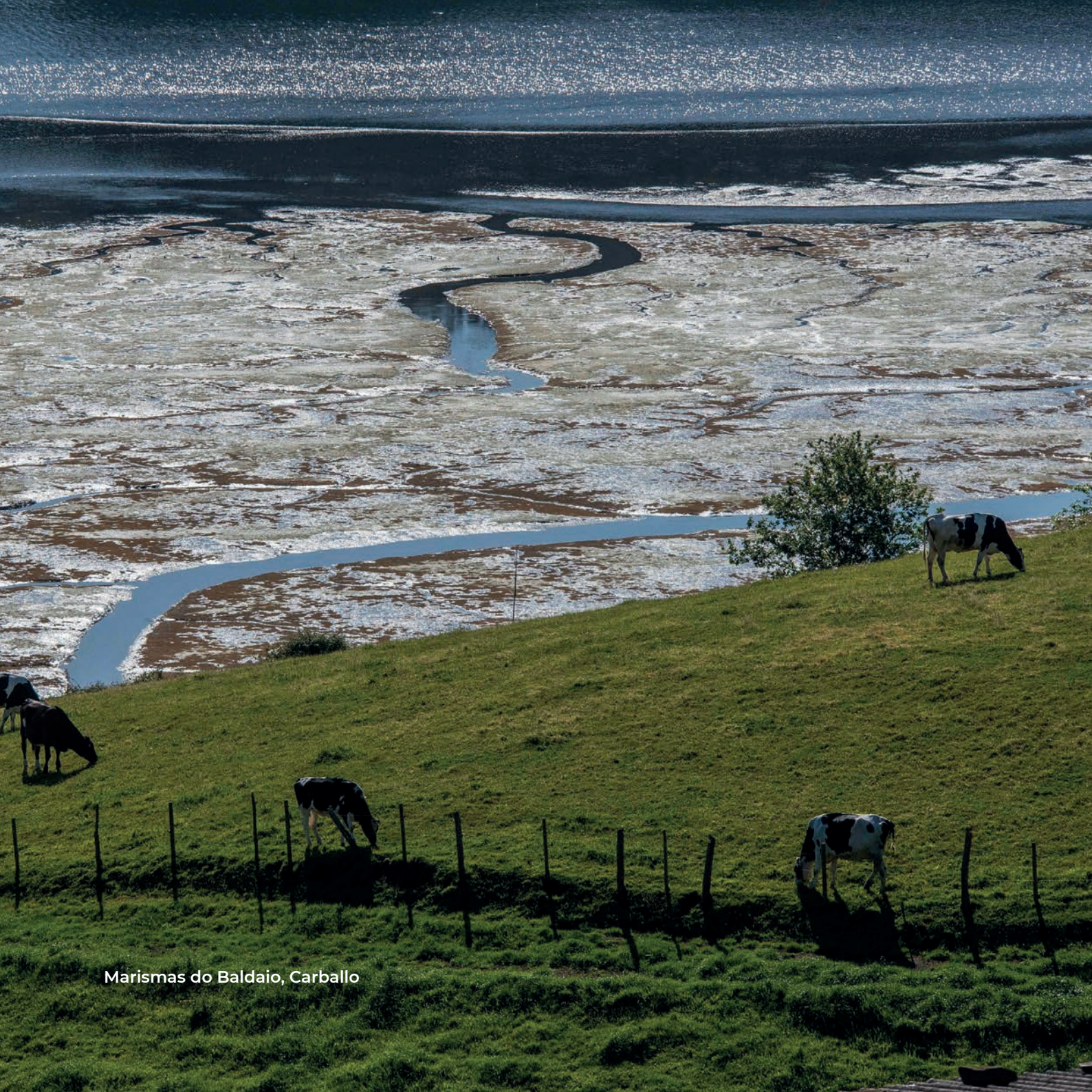
Marismas do Baldaio, Carballo