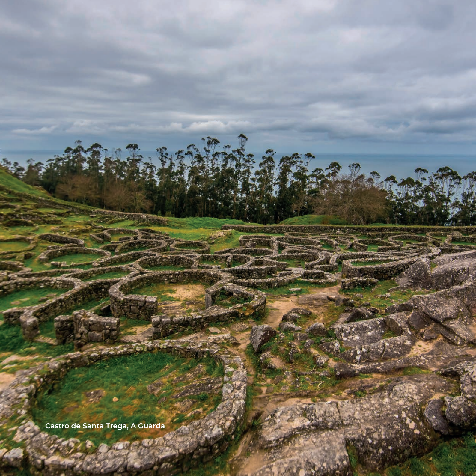
Castro de Santa Trega, A Guarda