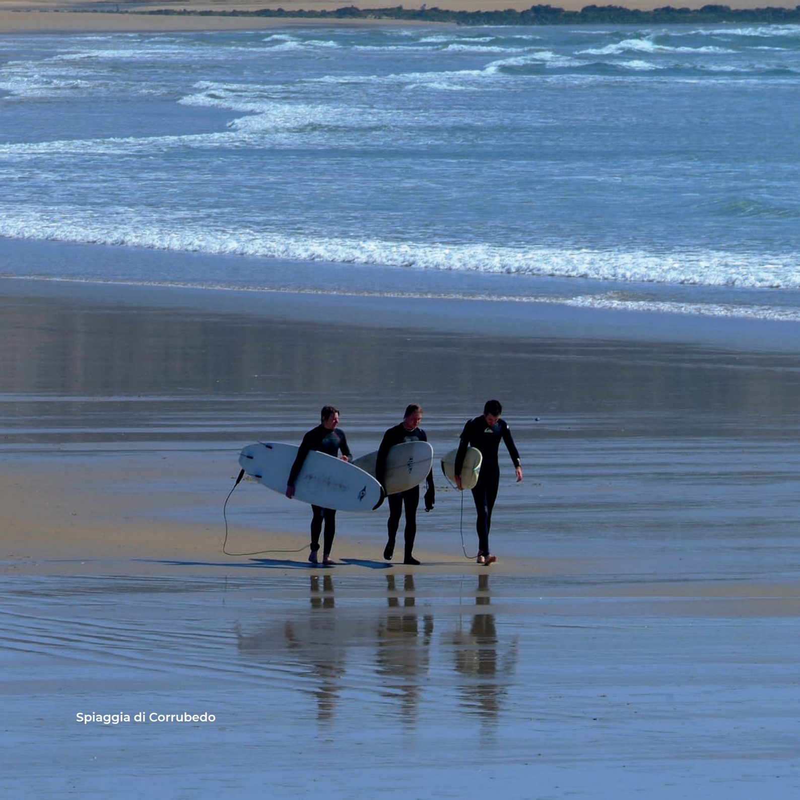
Spiaggia di Corrubedo