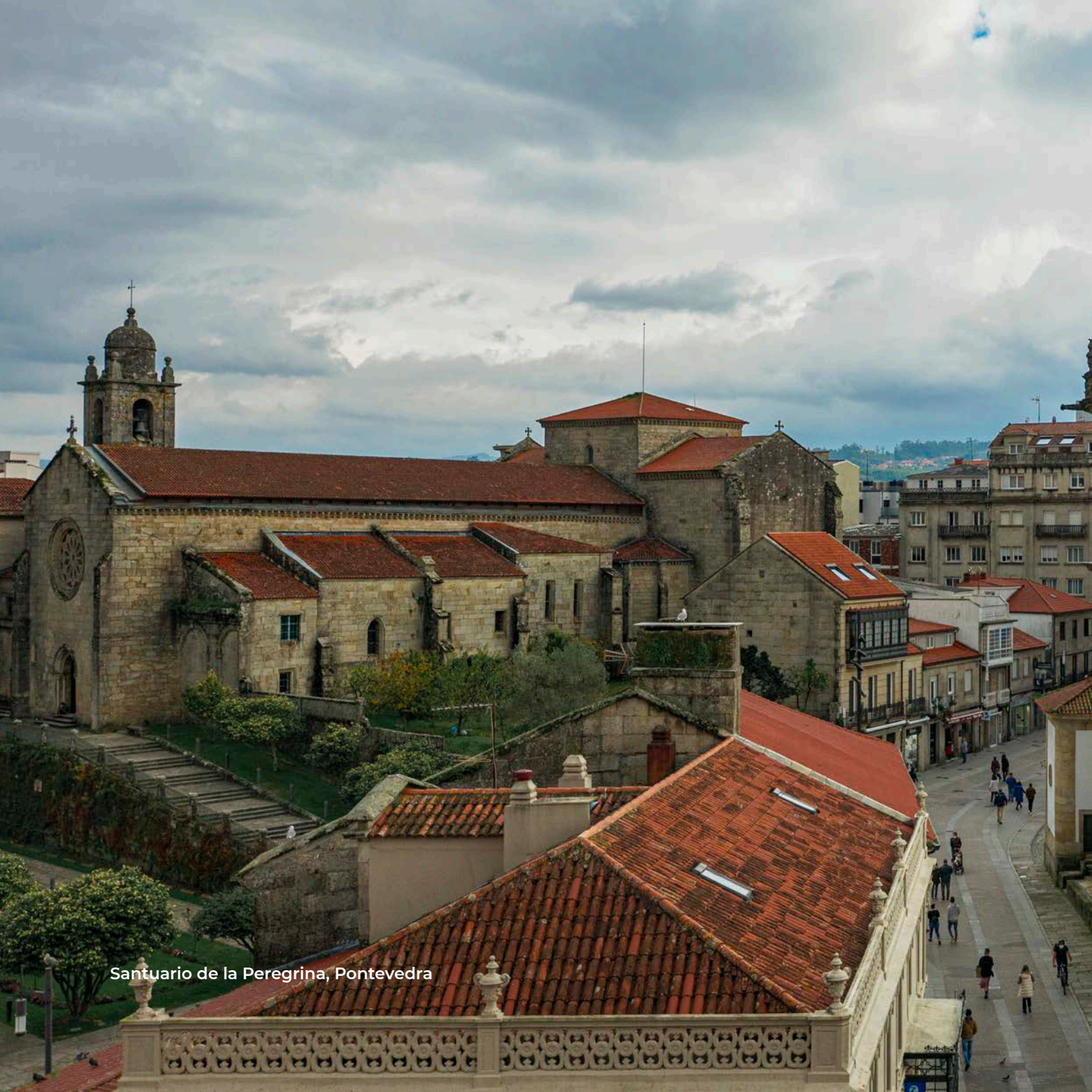
Santuario de la Peregrina, Pontevedra