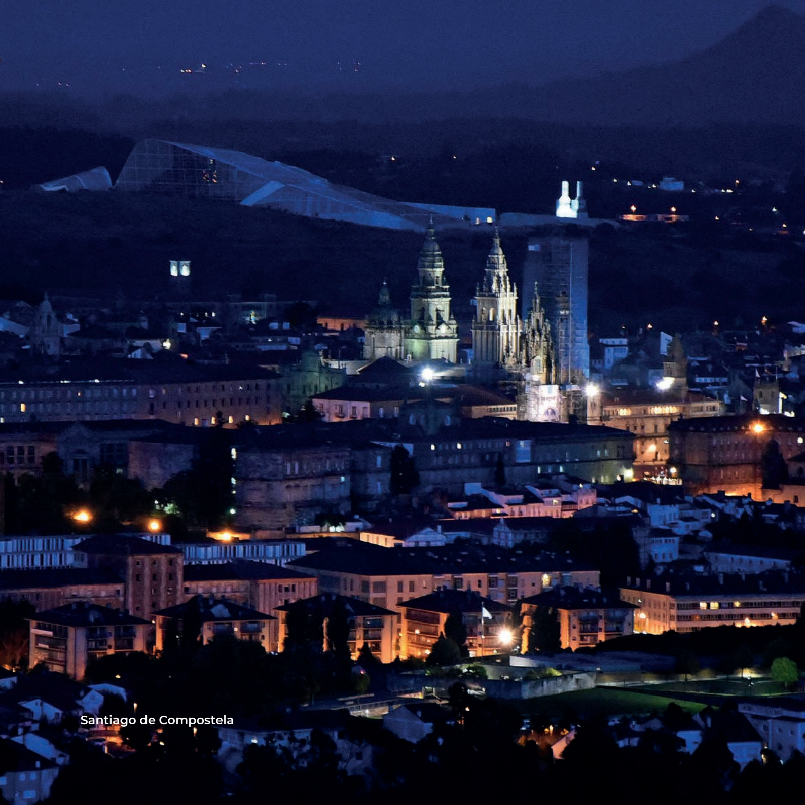
Santiago de Compostela