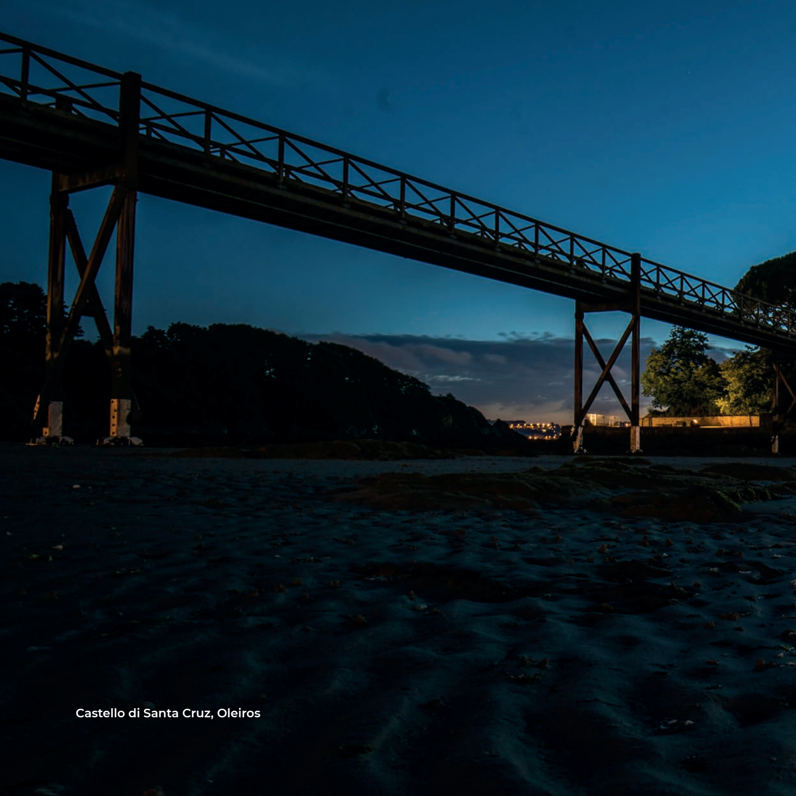
Castello di Santa Cruz, Oleiros