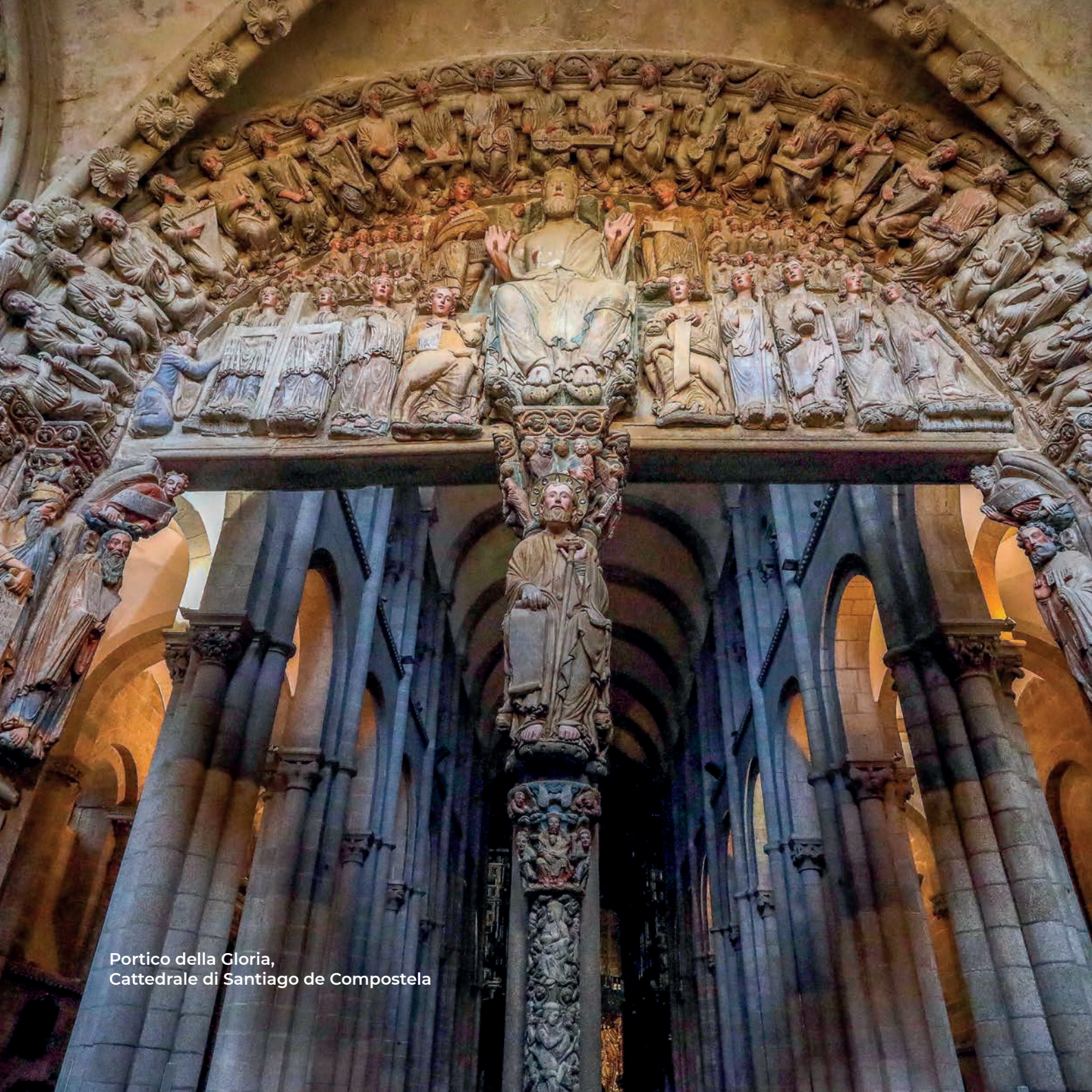
Portico della Gloria, Cattedrale di Santiago de Compostela