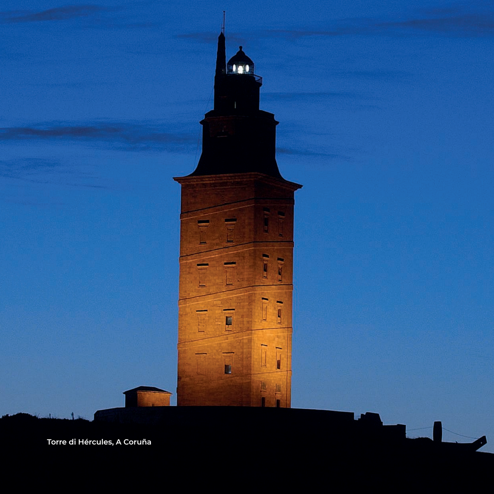
Torre di Hércules, A Coruña