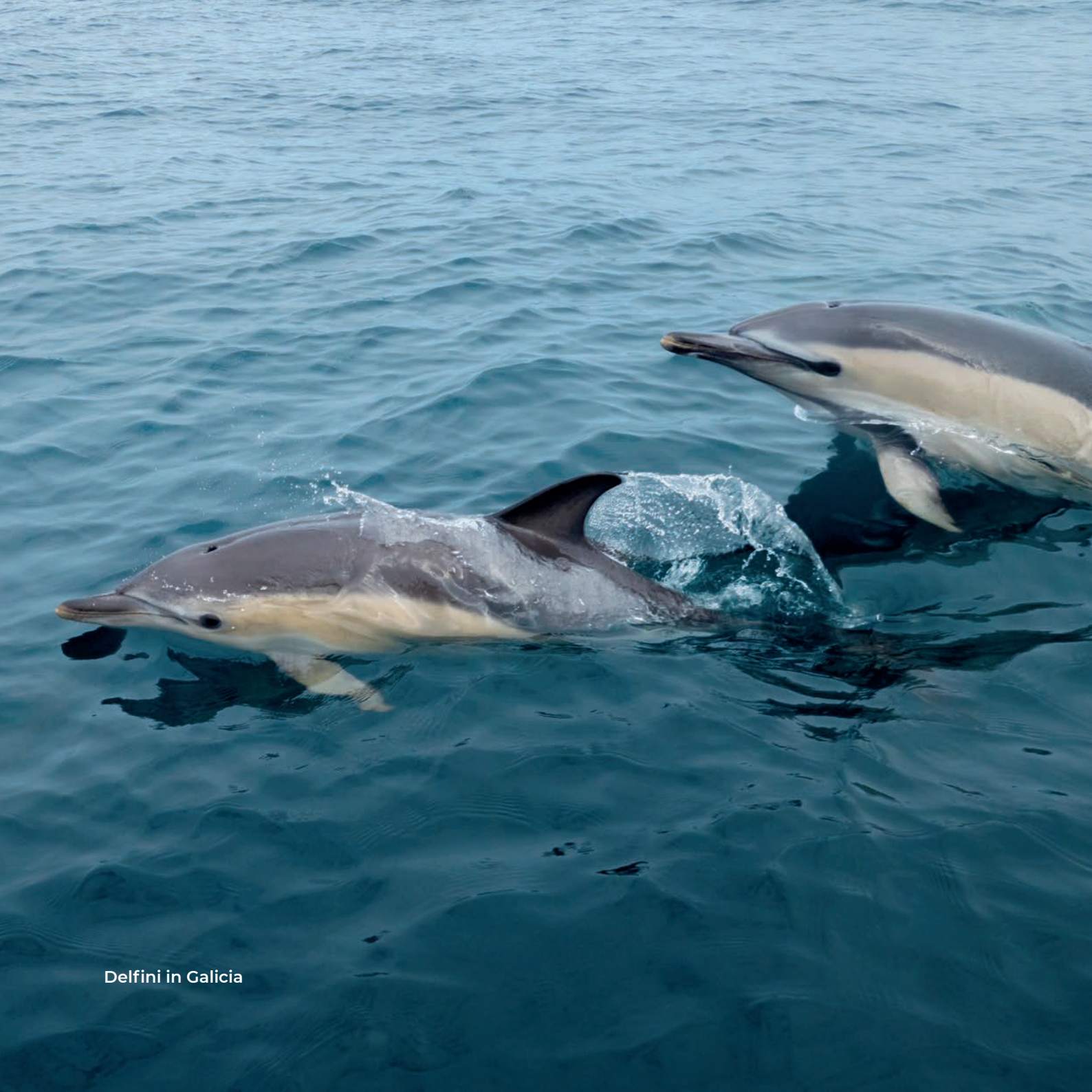
Delfini in Galicia