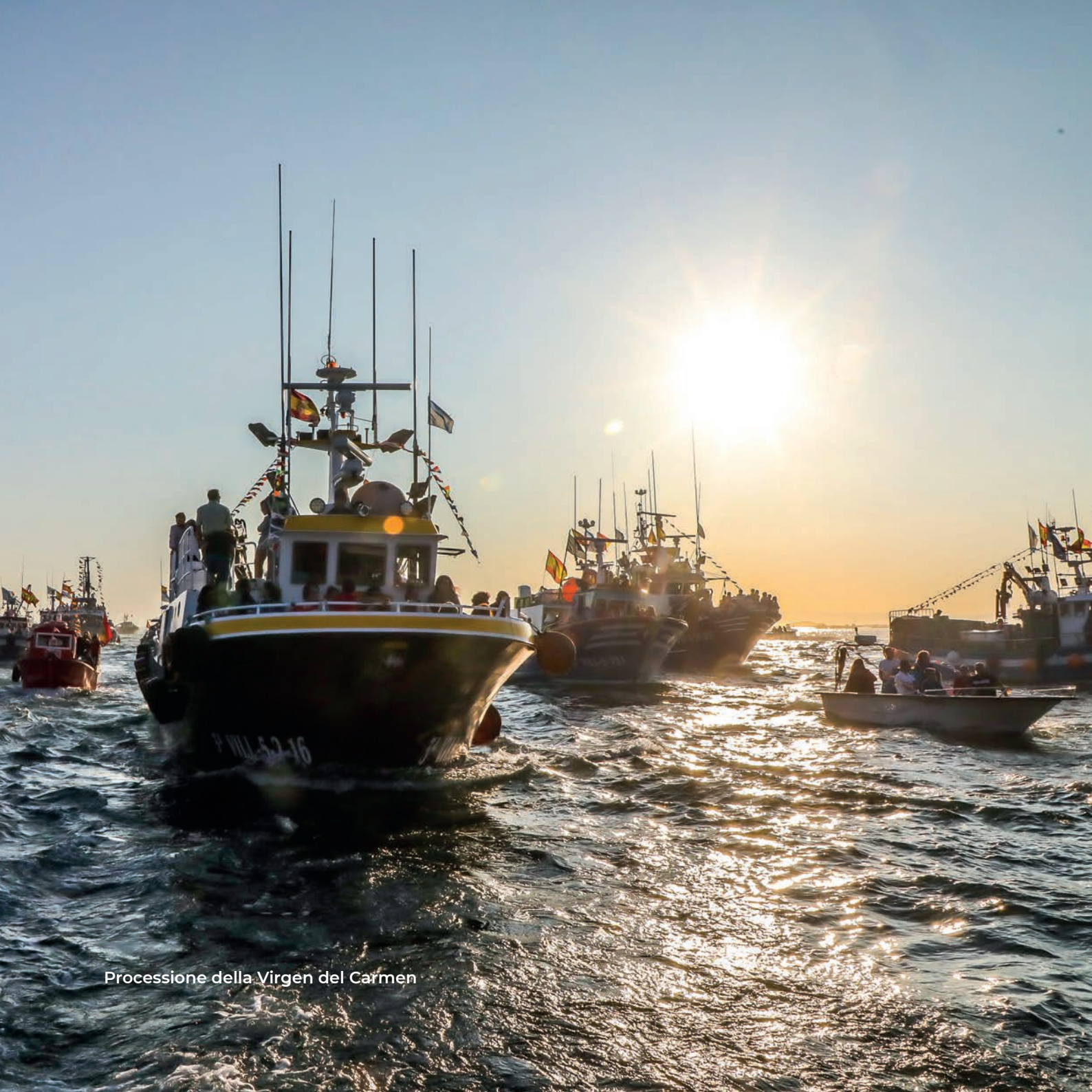
Processione della Virgen del Carmen