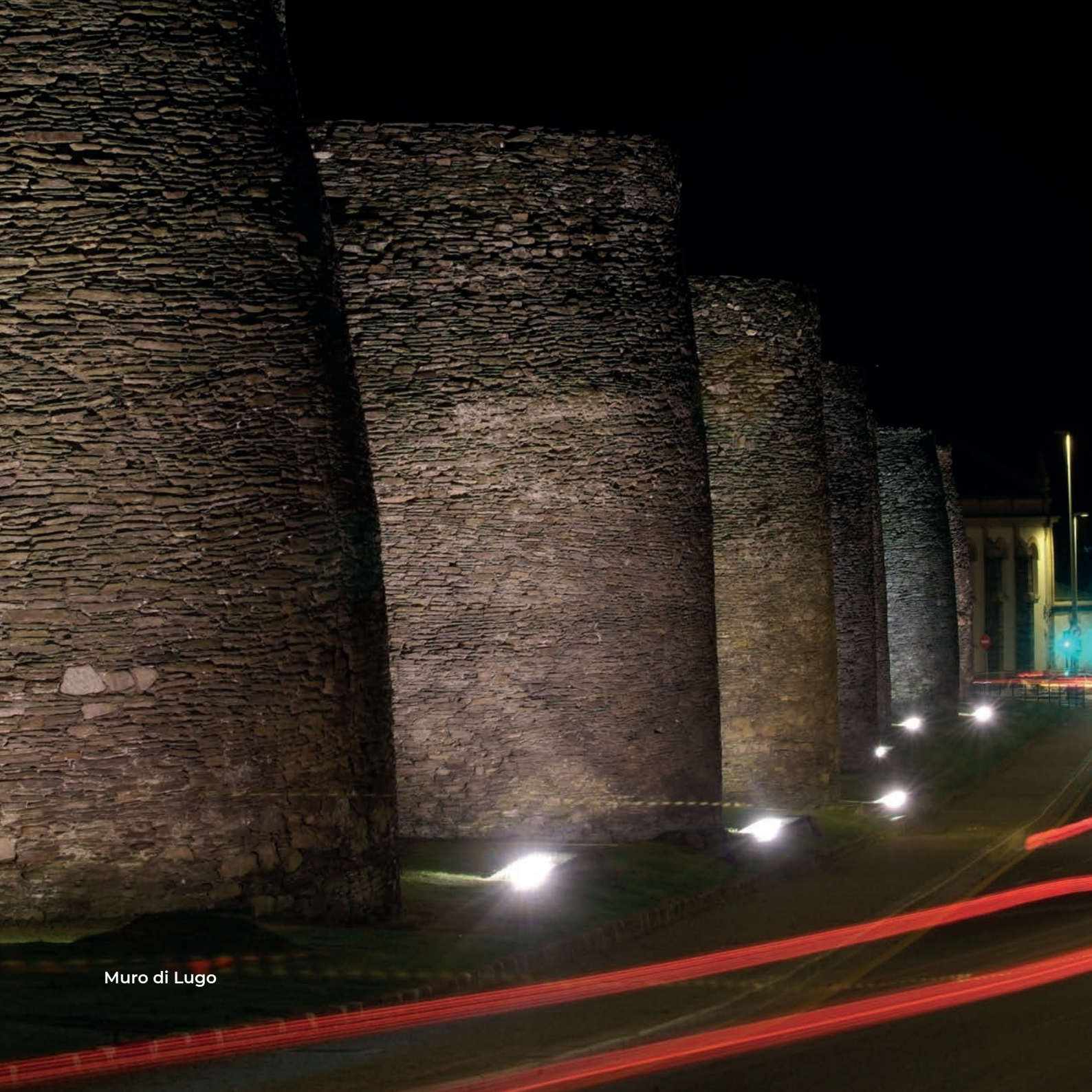
Muro di Lugo