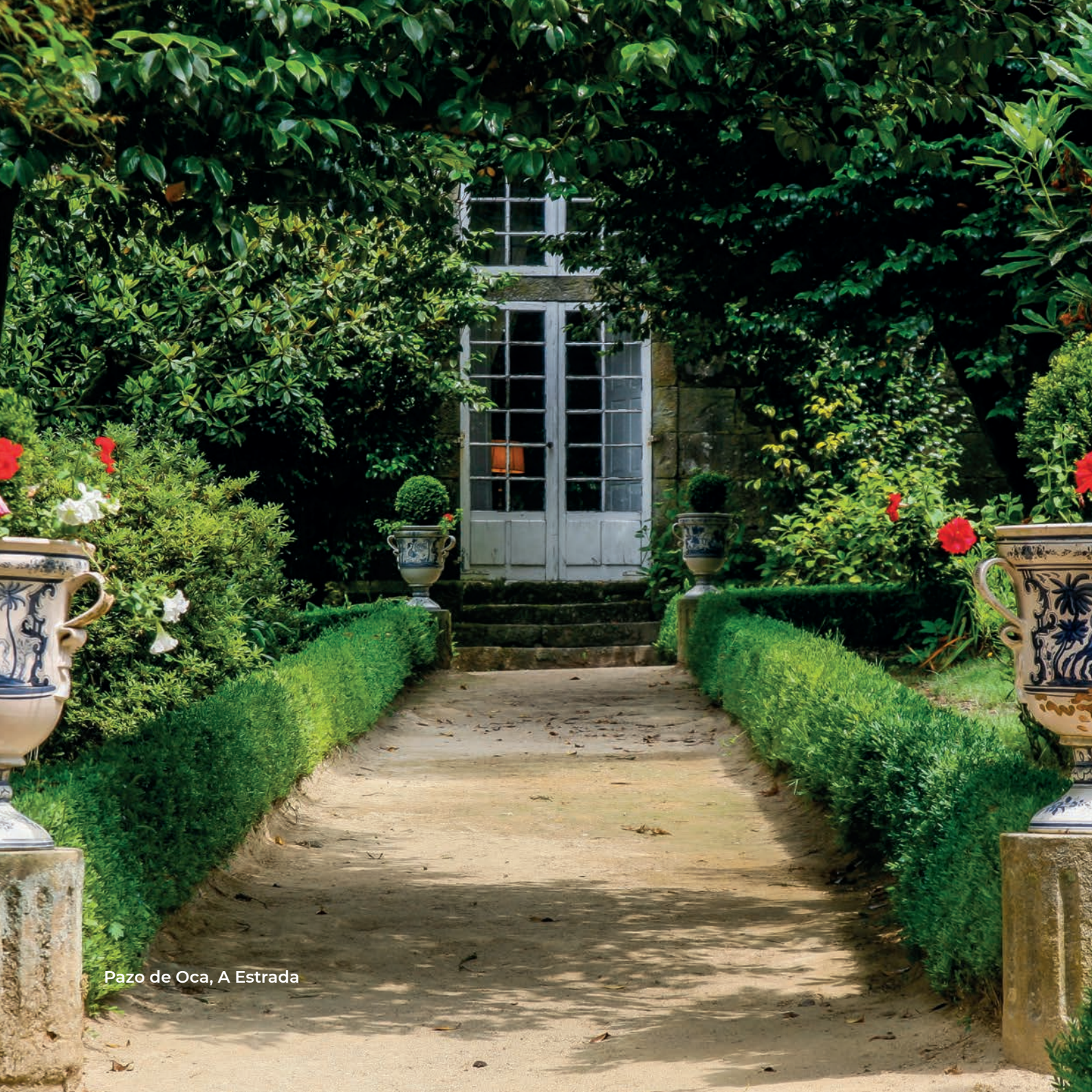
Pazo de Oca, A Estrada